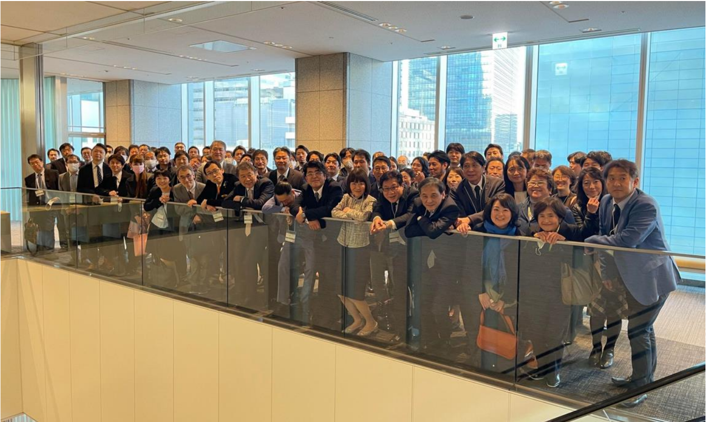
関東1 & 関東2 合同支部会より